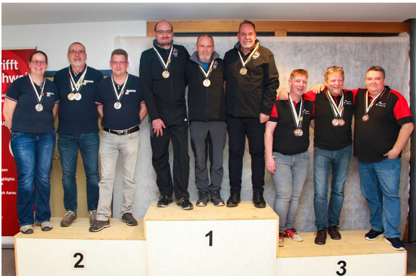
Finale cantonale 1ère place groupe pistolet sur appui