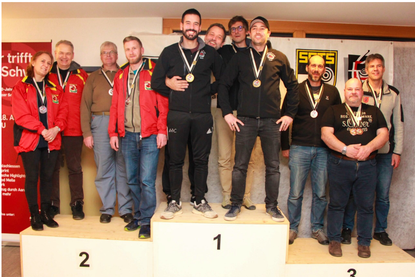
Finale cantonale 1ère place groupe pistolet bras franc