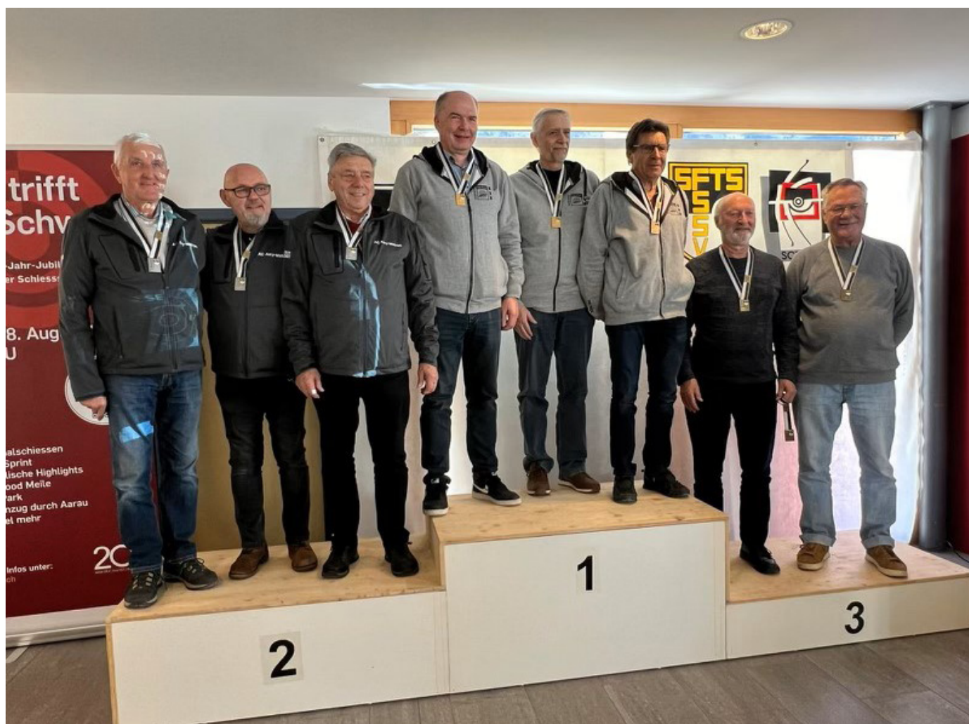
Finale cantonale 3ème place groupe carabine sur appui